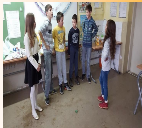
У школи смо учили